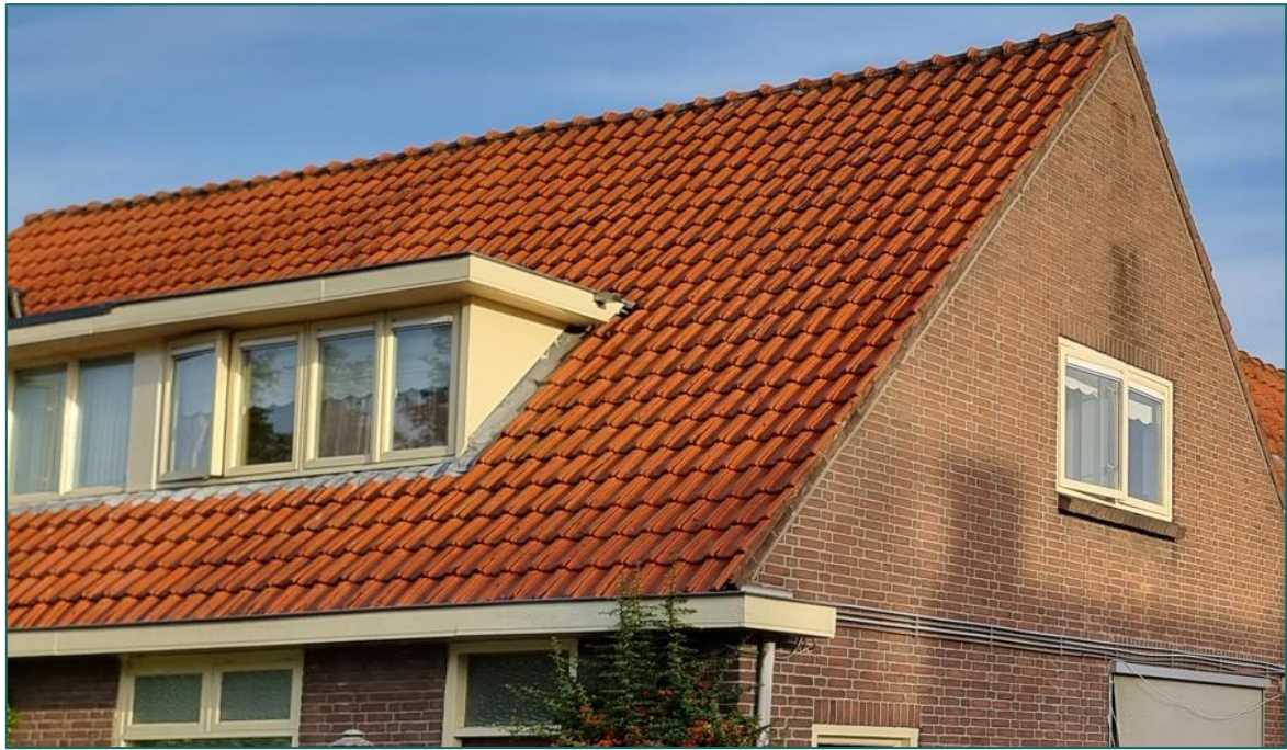
Figuur 3.1 De dakkapel wordt uitgebreid richting de kopgevel van de woning.

Op het perceel is in zeer beperkte mate sprake van groen in de geveltuin van de woning. Dit is van onvoldoende formaat om de huismus foerageer- en dekkingsmogelijkheden te bieden. Het voorkomen van nestlocaties van huismus op de planlocatie kan derhalve uitgesloten worden. De beoogde ruimtelijke ingreep leidt tot zeer beperkte aantasting van groene delen en resulteert niet in afname van essentieel leefgebied. Van aantasting van nestlocaties en functioneel leefgebied van de huismus is derhalve geen sprake.