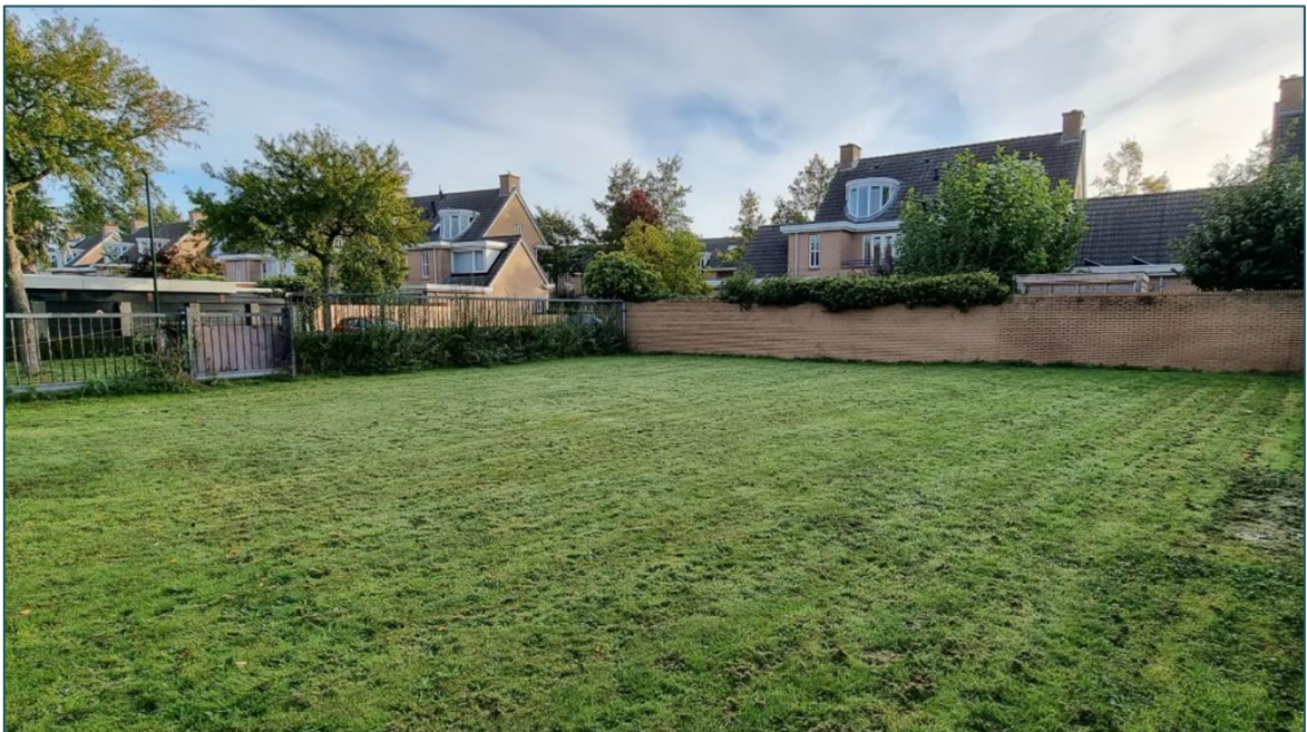
Figuur 4 De noordzijde van het perceel betreft een klein grasperceel.