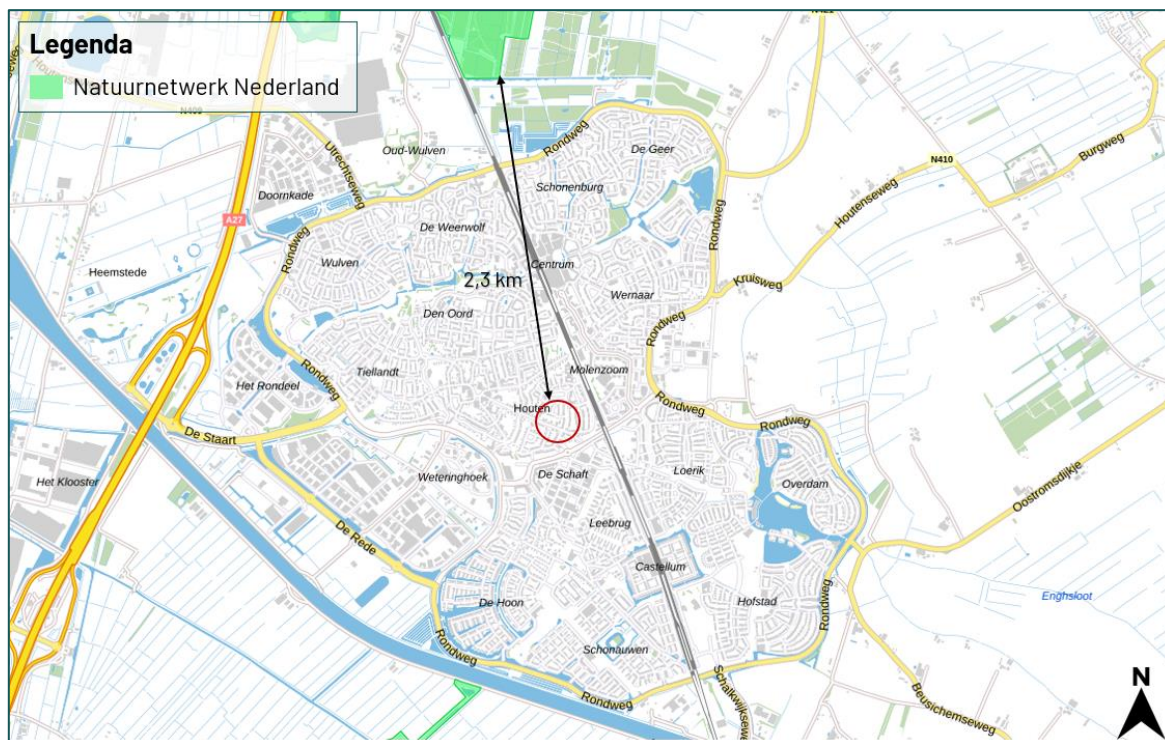
Figuur 3.3 De planlocatie ligt op een afstand van circa 2,3 km tot het Natuurnetwerk Nederland

De planlocatie maakt geen deel uit van een beschermd gebied betreffende het Natuurnetwerk Nederland, Groene contour of weidevogelkerngebied. Op een afstand van circa 2,3 km ligt het Natuurnetwerk Nederland (figuur 3.3). Op een afstand van circa 4,6 km ligt de Groene contour. Weidevogelkerngebied is gelegen op een afstand van circa 5,8 km van de planlocatie. Ten aanzien van provinciaal aangewezen gebieden geldt dat externe werking geen toetsingskader is.