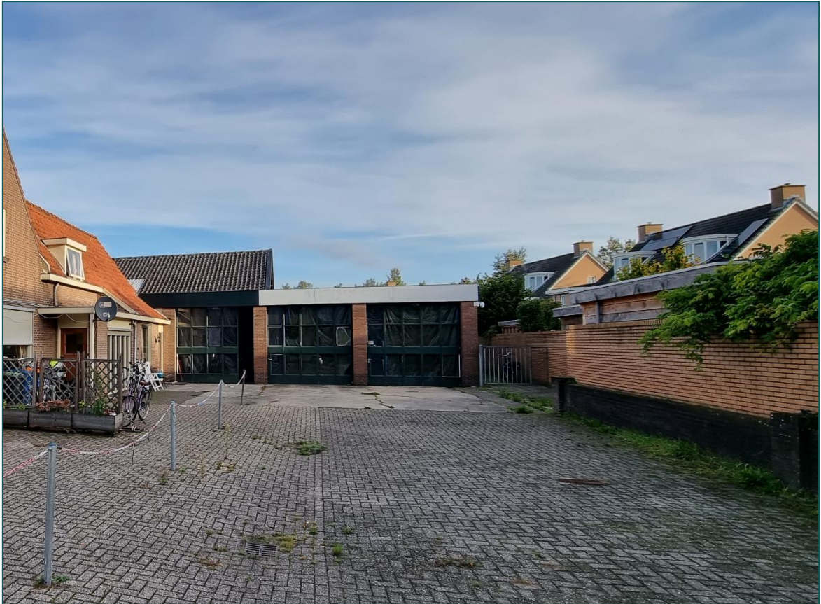
Figuur 3 Los van de bebouwing is er op de planlocatie en hoge mate van verharding.