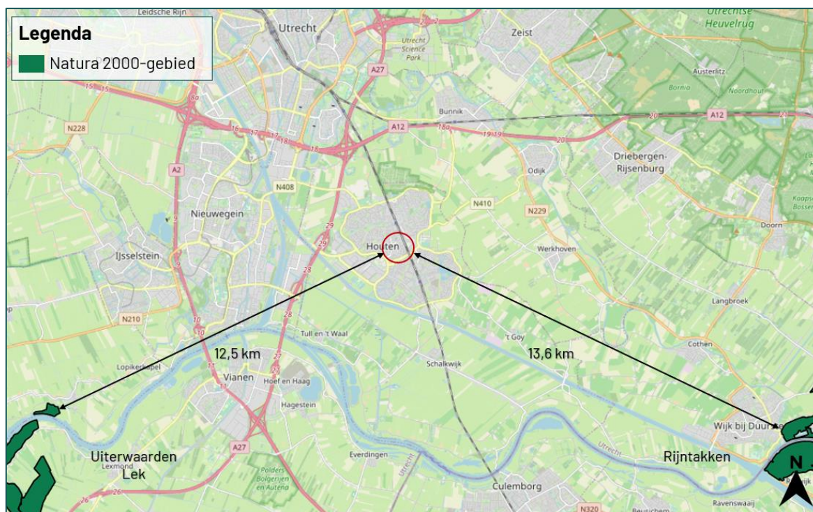
Figuur 3.2 De planlocatie ligt op een afstand van circa 12,5 km tot het Natura 2000-gebied 'Uiterwaarden Lek'.

De planlocatie maakt geen deel uit van een Natura 2000-gebied. Op een afstand van circa 12,5 km ligt het Natura 2000-gebied 'Uiterwaarden Lek' (figuur 3.2).