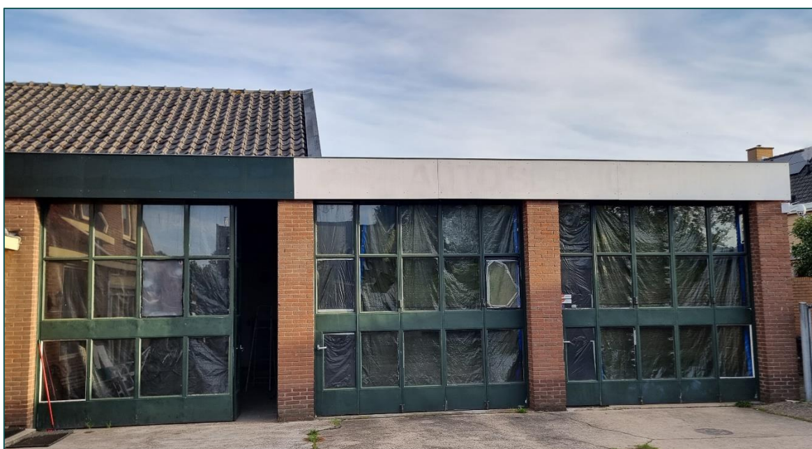
Figuur 2 De voormalig bedrijfsgarage bestaat uit enkel steens muren met deels plat bitumen en deels zadeldak met dakpannen.