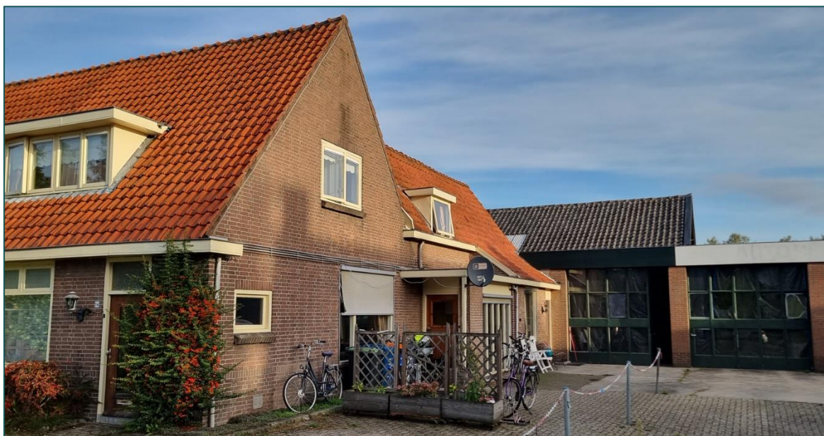
Figuur 1 De planlocatie is gelegen aan de Loerikseweg 54 te Houten en bestaat uit een woonhuis en voormalig bedrijfsgarage.