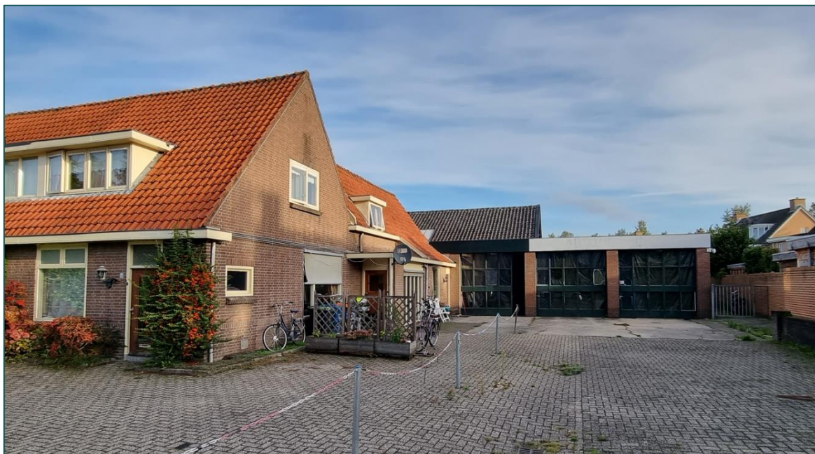
Figuur 1.1 De planlocatie is gelegen aan de Loerikseweg 54 te Houten.